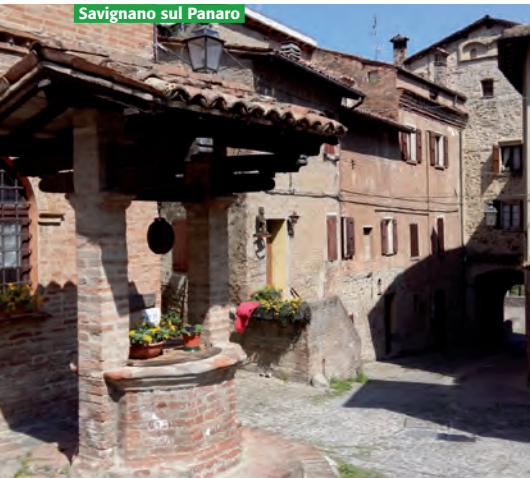
Savignano sul Panaro