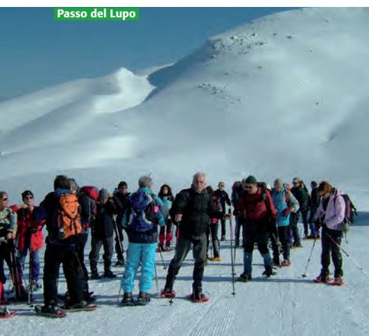
Passo del Lupo