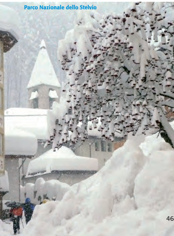
Parco Nazionale dello Stelvio

Il versamento della caparra valida l'iscrizione. Il saldo deve essere effettuato almeno 20 giorni prima della partenza.